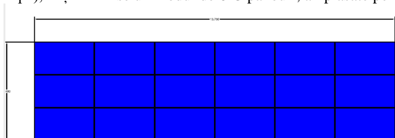
MODUL DISPUNERE PANOURI FOTOVOLTAICE ÎN BATERIE 6 x 3 PANOURI FOTOVOLTAICE ASEZATE TIP VEDERE

Pentru o valorificare optima a terenului se propune gruparea a cate 18 panouri , dispuse pe 3 rânduri orizontale (landscape), obținându-se un modul de 6x3 panouri, amplasate pe o structura metalică.