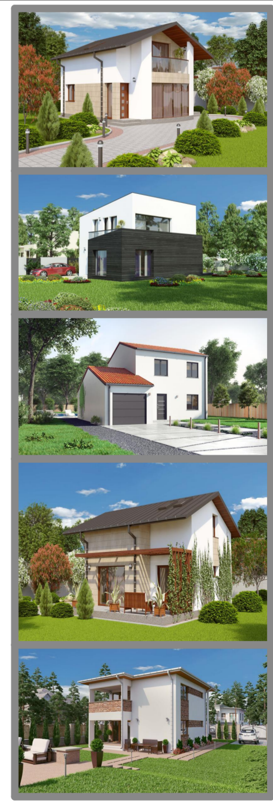
Imaginile sunt cu titlu de prezentare. Licenta ActCAD 2022

Manole Dascalu Digitally signed by Manole Dascalu Date: 2023.05.18 10:08:27 +03'00'