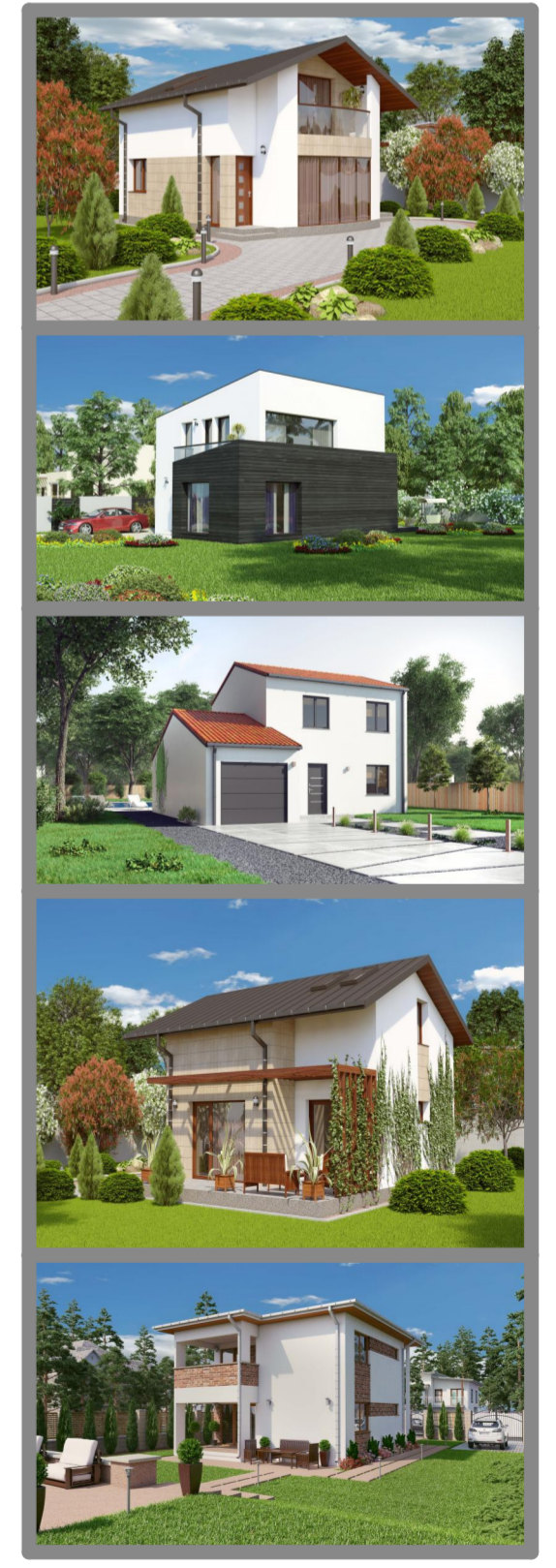
Imaginile sunt cu titlu de prezentare.