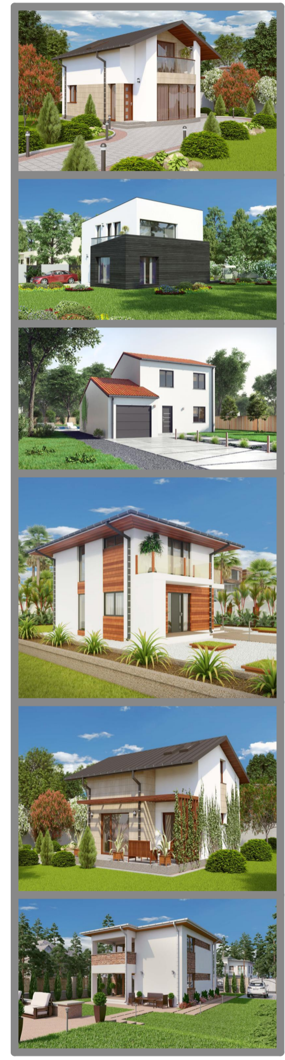
Imaginile sunt cu titlu de prezentare.