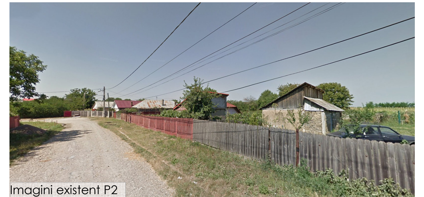
Imagini existent P2