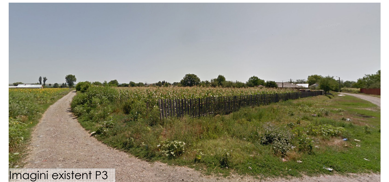
Imagini existent P3