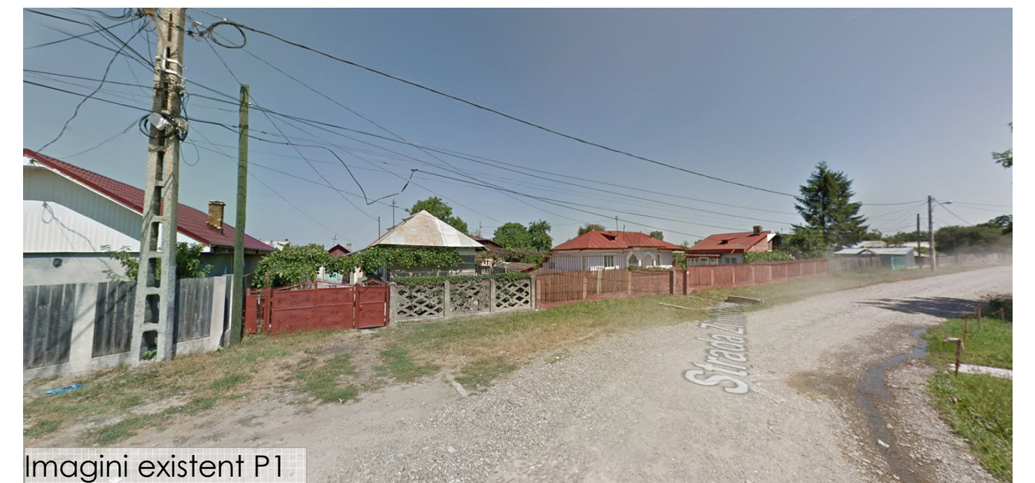
Imagini existent P1