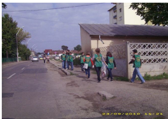
-elevi în acțiune-

... noi facem curățenie la în camera proprie... Plecând de la această relatare a unui copil, am extrapolat totul la nivelul Municipiului Roman și am avut succes.